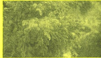
目に見えない1 \mu m未満の泡

目に見える泡は10秒程で消滅してしましますが、ウルトラファインバブルは数週間から数か月も水中に残る特性と直径1マイクロメートル未満の微細な泡で細かい隙間に入り込み汚れを落とす作用が話題となり幅広い分野で活用されています。洗浄効果に優れ汚れや水垢を抑制しお肌にも優しく潤い効果が得られる事から水廻り分野で製品化が進みシャワーや洗濯機などラジオやテレビコマーシャルが流れ良く耳にするようになったと思います。